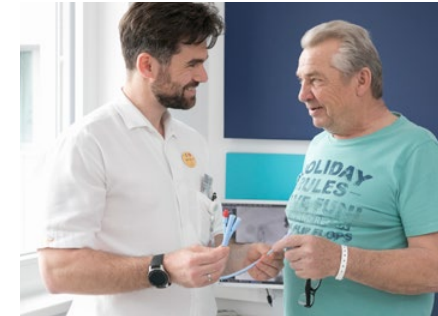
Das ATOMS Implantat hilft Männern bei Inkontinenz.