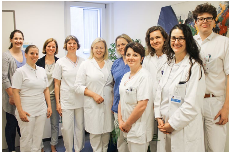
Expertinnen und Experten verschiedener Fachrichtungen arbeiten im Beckenbodenzentrum Hand in Hand zusammen