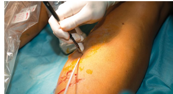
Krampfadern (Varizen) können sanft mit Laser entfernt werden.

Alle Eingriffe werden, wenn möglich, minimal-invasiv oder mit SILS-Technik (ein Schnitt im Nabelbereich) durchgeführt. Über diesen gelangen die Operationsinstrumente sowie Licht und Kamera an den Operationsort. Die Chirurgen und Chirurgen operieren via Bildschirm (laparoskopisch). Die Patientinnen und Patienten profitieren von der rascheren Genesung mit weniger Beschwerden (Narben, Infektionsrisiko sowie Schmerzen) nach einer Operation.