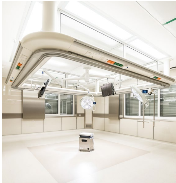
Hochmoderner OP am neuesten Stand der Technik.

Wir bieten unseren Patientinnen und Patienten eine ausgezeichnete rundum-die-Uhr Versorgung. Eine Intensivstation der Stufe 2 sowie ein Intermediate Care Unit (IMCU) bieten höchste Sicherheit.