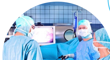
Führung in den OP