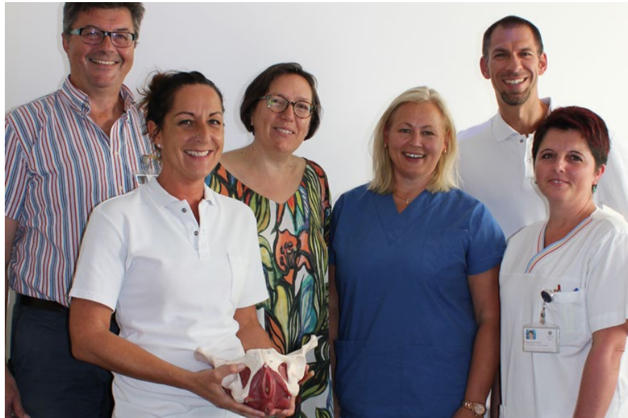
Expertinnen und Experten verschiedener Fachrichtungen arbeiten im Beckenbodenzentrum Hand in Hand zusammen