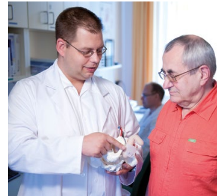
Das ATOMS Implantat hilft Männern bei Inkontinenz.